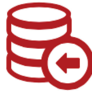
Banca Dati Excelsior

Excelsior è un'indagine realizzata da Unioncamere e ANPAL che fornisce informazioni sulle previsioni di assunzione e analizza i fabbisogni formativi e professionali delle imprese italiane dell'industria e dei servizi.