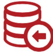
Banca Dati Excelsior

Excelsior è un'indagine realizzata da Unioncamere e ANPAL che fornisce informazioni sulle previsioni di assunzione e analizza i fabbisogni formativi e professionali delle imprese italiane dell'industria e dei servizi.